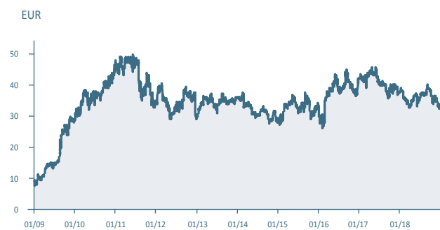
Koers van het aandelen

Gedetailleerde en historische informatie over de koers en de verhandelde volumes is beschikbaar op de website van D'Ieteren ( www.dieteren.com ).